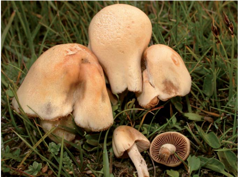
Abb. 1: Conocybe ammophila , Standortaufnahme