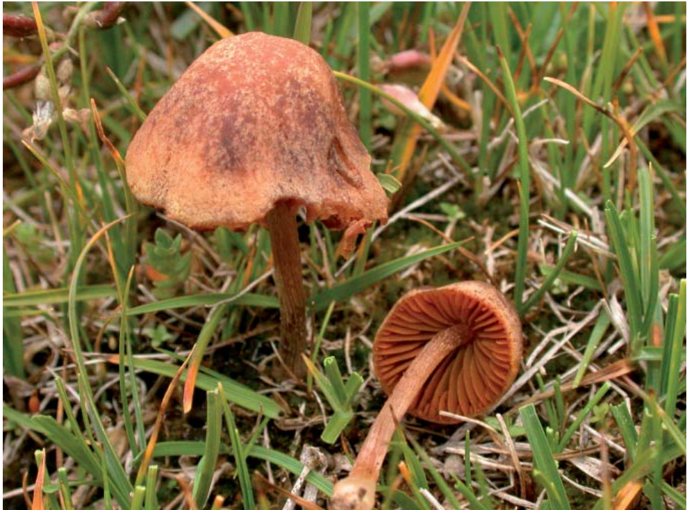
Abb. 3: Conocybe murinacea , Standortaufnahme