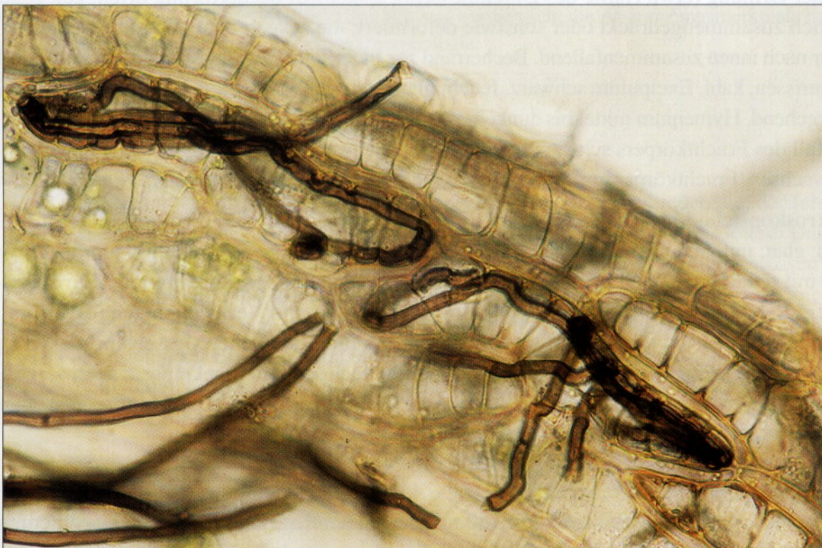
Abb. 3: Hyalozyten mit Mycelhaaren von P. sphagnophila