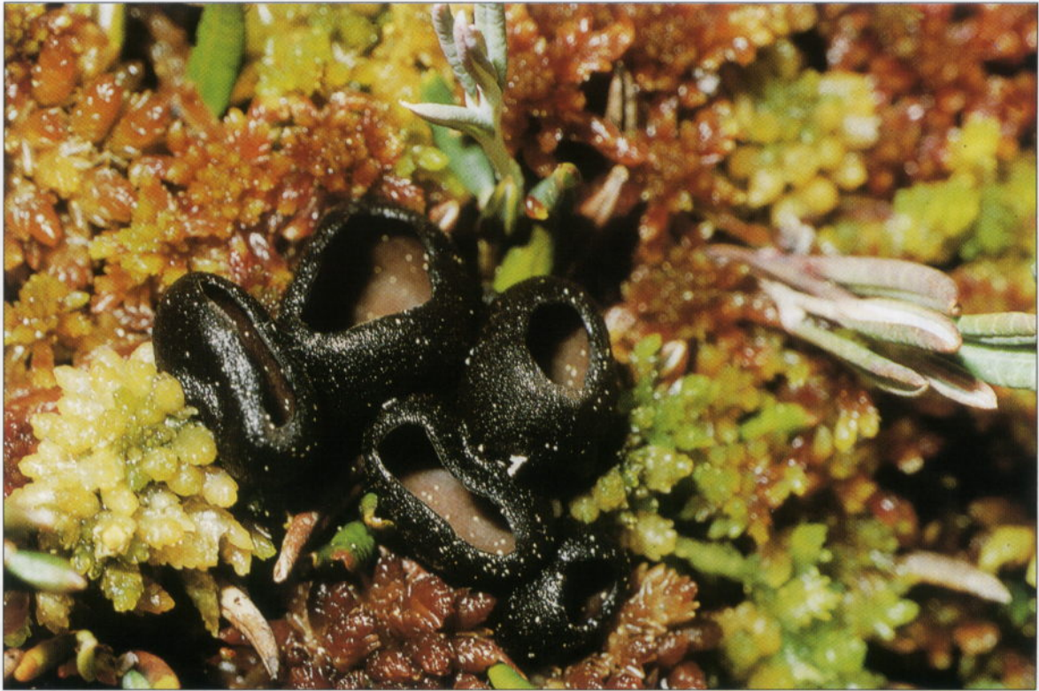
Abb. 1: Pseudoplectania sphagnophila