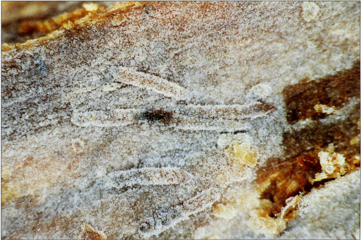
Abb. 2: Repetobasidium vile (3 x 2 mm)

in reinen Fichtenwäldern und Lärchen-Fichten-Wäldern, vornehmlich in naturnahen Beständen (u. a. in zwei Naturwaldreservaten). Zumeist zeichnen die Lebensräume sich durch eine offene Struktur und ein trockenes Lokalklima aus, jedoch fielen in allen Fundgebieten vereinzelt vernaßte Bodenstellen oder kleine Gerinne auf. In einer Untersuchungsfläche im Lungau trat die Art in einem Massenaspekt auf, und manche Fruchtkörper bedeckten eine Fläche von mehreren dm 2 .