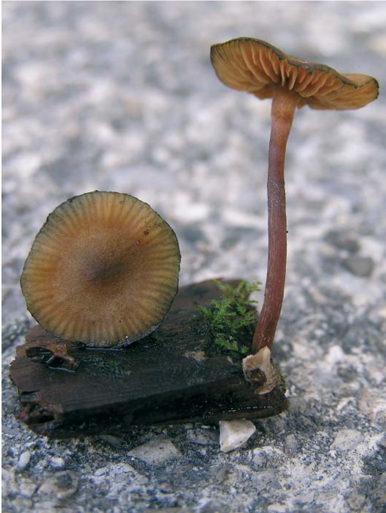
Abb. 1: Galerina steglichii Besl