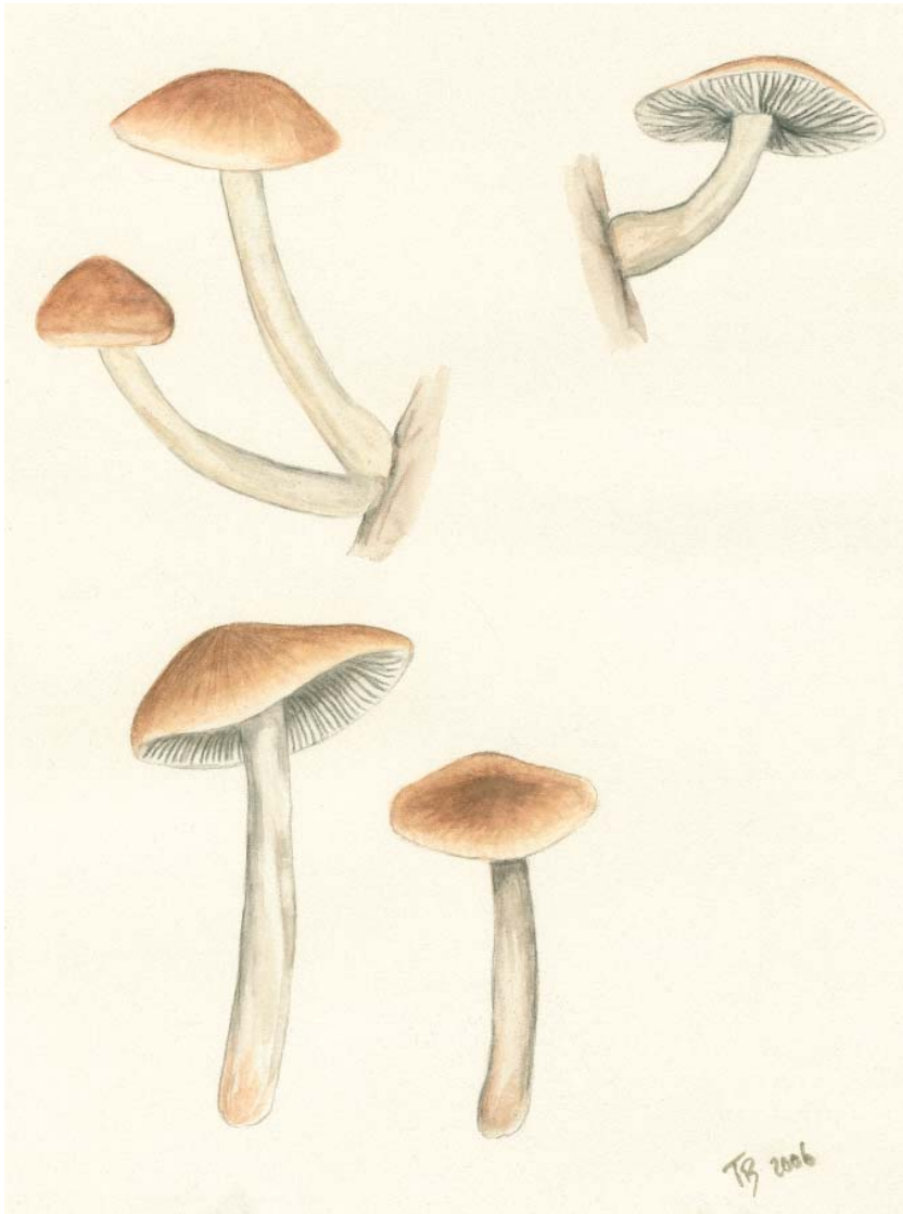
Abb. 3: Hydropus collybioides Gminder ad int.