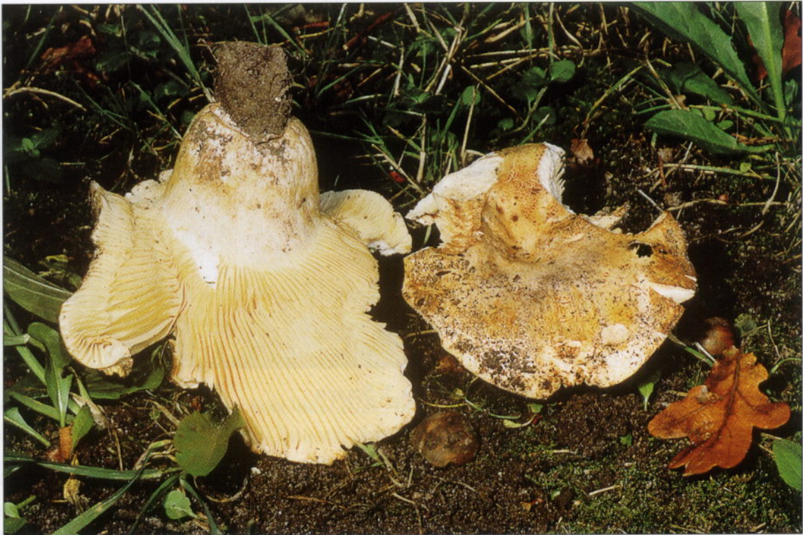
Abb. 1: Russula flavispora am Standort in Niendorf